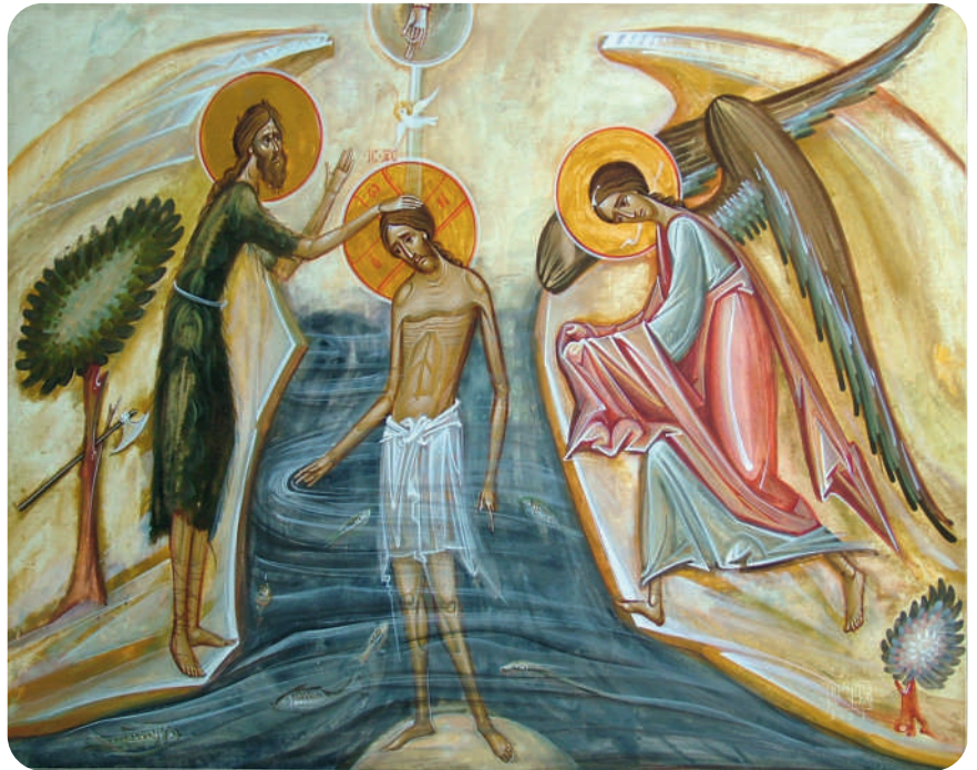
Botezul Domnului Iisus Hristos

În zilele acelea, a venit Ioan Botezătorul și propovăduia în pustia Judeii, spunând: Pocăiți-vă că s-a apropiat împărăția cerurilor. El este acela despre care a zis prorocul Isaia: „Glasul celui ce strigă în pustie: Pregătiți calea Domnului, drept faceți cărările Lui”. Matei 3, 1-3