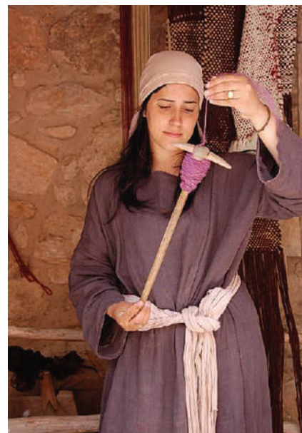
Scene din viața zilnică a evreilor