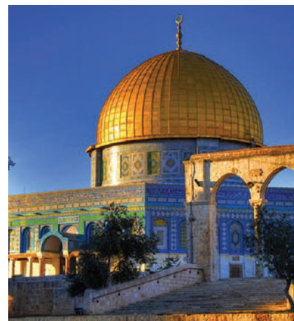
Cupola sau Domul Stâncii, conform tradiției, adăpostește locul de rugăciune al patriarhului Avraam.