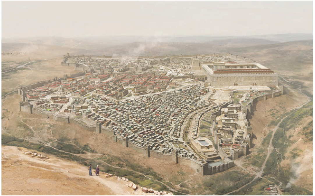
Ierusalimul în vremea lui Iisus Hristos

Și mare va fi stăpânirea Lui și pacea Lui nu va avea hotar. Va impărăți pe tronul și peste impărăția lui David, ca s-o întărească și s-o intemeieze prin judecată și prin dreptate, de acum și până-n veac. Isaia 9, 6