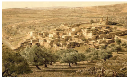
Imagini din Țara Sfântă

1. Cu ajutorul textului și al imaginilor de mai sus descrie diferite aspecte din viața socială a populației evreiești din vremea Mântuitorului.